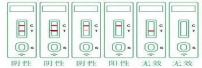
图2 结果判定示意图

加样后开始计时，在5min内，用肉眼观察测试区和质控区，判断结果，其他时间判断无效。见图2